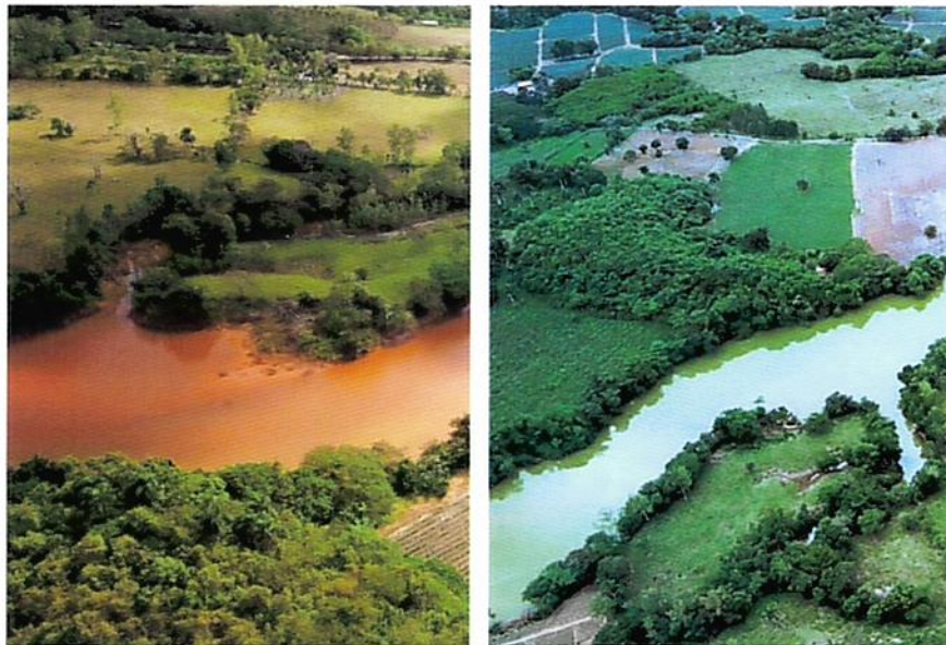
Figura 1: Río Margajita en 2012 (izquierda) y ahora (derecha)

Debido al trabajo de remediación que Pueblo Viejo ha estado realizando desde el 2012, las aguas de la represa Hatillo cumplen con los estándares de calidad de agua dominicanos aplicables. Esta extensa campaña de remediación ha sido muy exitosa. Para dar solo un ejemplo, la calidad del agua ha mejorado al punto que la Asociación de Productores de Pescado de Hatillo pudo establecer un programa de crianza de peces (especialmente tilapia y trucha), que produce alrededor de 50 toneladas de pescado por año, generando ingresos significativos. y oportunidades de empleo en la zona.